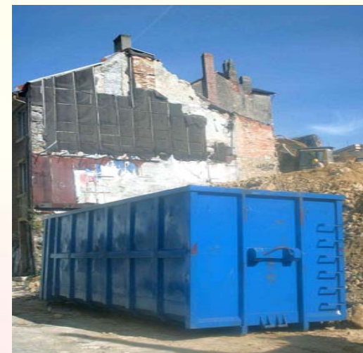
Chantier du Tertre 20, début le 8 août 2002