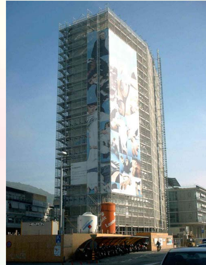
Office fédéral de la statistique (OFS)