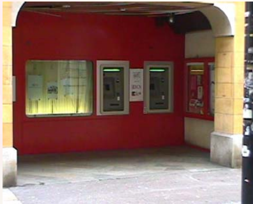
Enquête sur la sécurité à proximité des « bancomats »

Rendre le centre-ville de Neuchâtel plus sûr. Ceci par le biais de projets tels que :