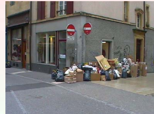
Contrôle et dénonciation des personnes qui déposent les ordures en dehors des jours autorisés afin d'éviter les risques d'incendie.