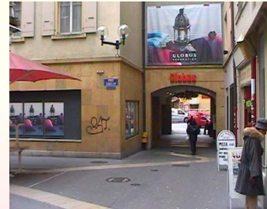
Campagne de prévention VOLS DANS LES MAGASINS