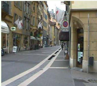
Etude pour une campagne d'affichage dans les rues ATTENTION AUX VOLS