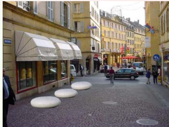
Projet de protection de vitrines contre les attaques par coup du bélier