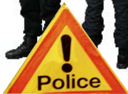
Veste des services de circulation